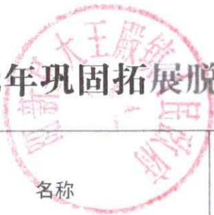
大王镇2022年巩固拓展脱贫攻坚成果和乡村振兴补助资金项目使用情况拨付表