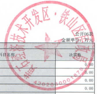
一般公共预算财政拨款基本支出决算明细表