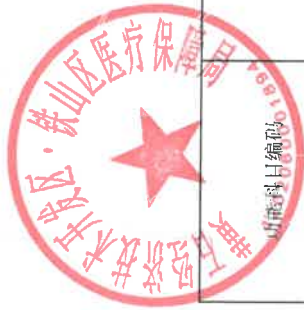
2022 年 部 门 支 出 预 算 情 况 表